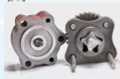
Etanchéité des filetages ergo.® 4052 + ergo.® 4453