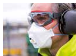
Préservez votre vision Page 7