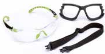
3M™ Solus™ 1000 Légères, pratiques, polyvalentes