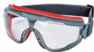
3M™ GoggleGear 500 Confortables, ergonomiques. Peuvent être équipées de verres correcteurs (en option)