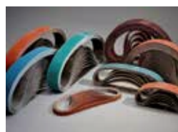
Confection de bandes abrasives Page 6