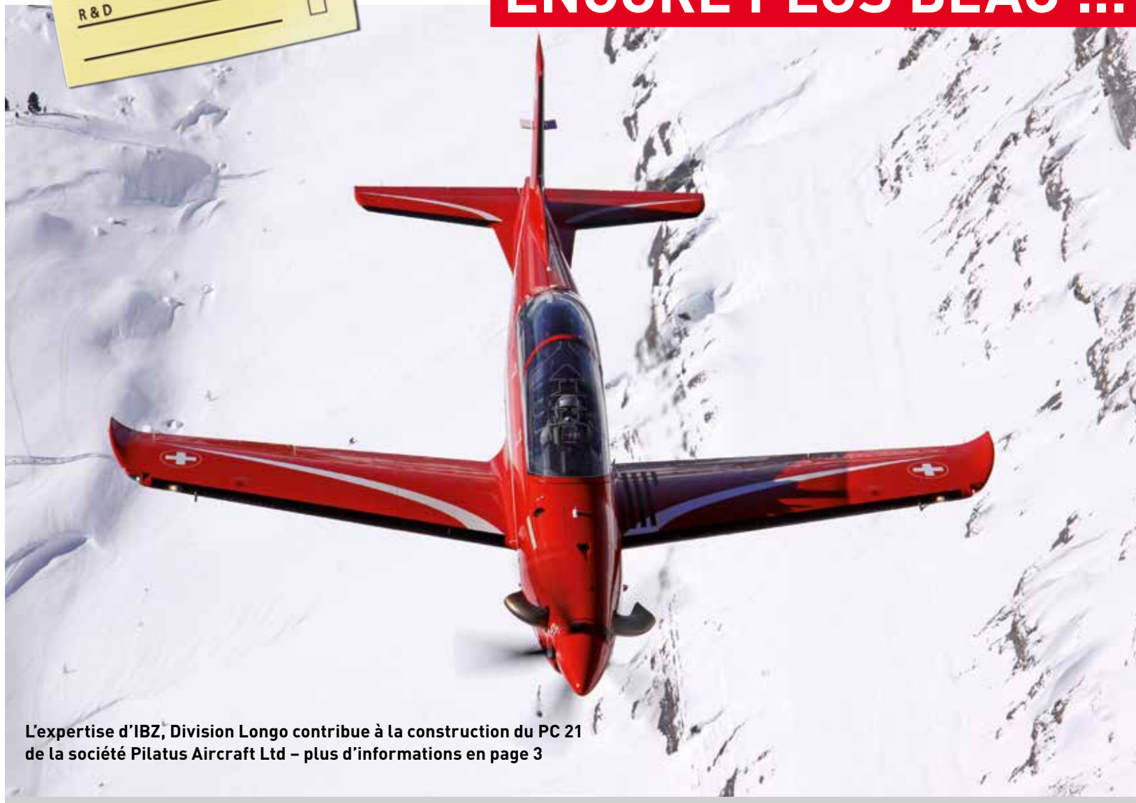
L'expertise d'IBZ, Division Longo contribue à la construction du PC 21 de la société Pilatus Aircraft Ltd – plus d'informations en page 3