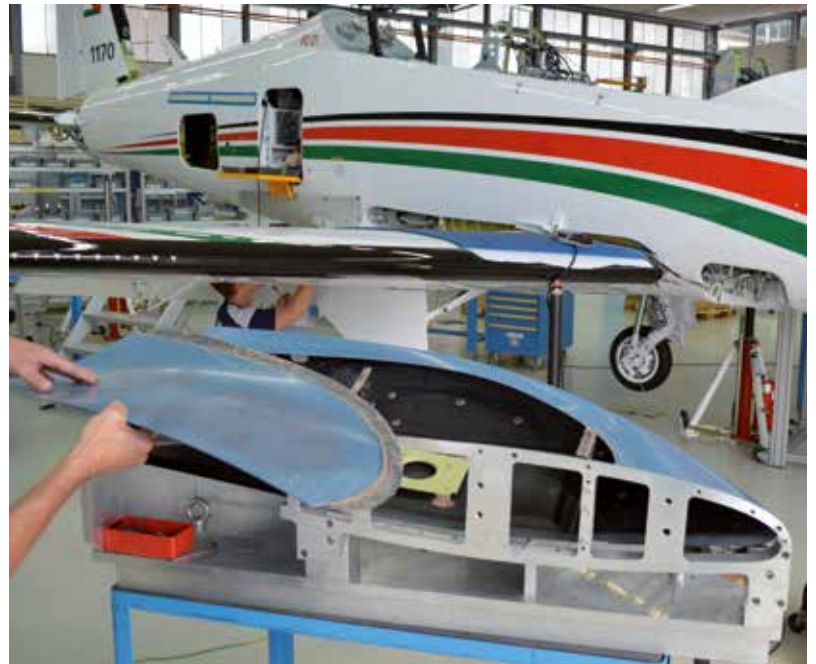
L'adhésif époxy 2K est le produit idéal pour l'assemblage de pièces d'ailes du PC 21.

Le PC-21 atteint des vitesses de plus de 600 km / h. Les forces agissant sur le pilote et la machine sont de 4 à 8 G. C'est à dire jusqu'à 8 fois le poids. Cela signifie, en particulier, que les assemblages collés doivent supporter des contraintes énormes. Pour des pièces aussi stratégiques, seul un bon choix du produit et une mise en œuvre parfaite peuvent garantir un assemblage permanent et fiable.