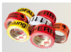
Rubans adhésifs imprimés Page 5