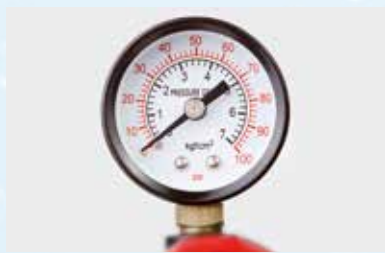
Fixation et étanchéité d'appareils de mesure ergo.® 4211