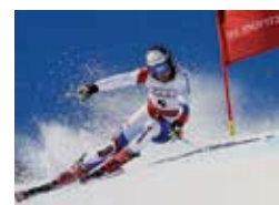
Concours: séjour gratuit à St. Moritz Page 8