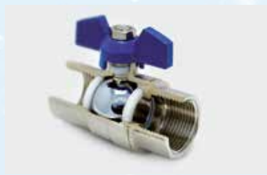
Assemblage de joints cylindriques ergo.® 4453