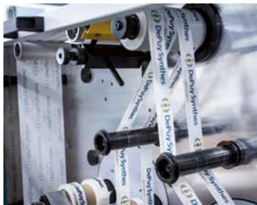
Impression flexographique: ruban d'emballage en 4 couleurs

Le champ d'application des rubans adhésifs imprimés est multiple: comme ruban d'information, d'identification, de mise en garde, d'emballage et bien plus encore. Il n'y a pas mieux comme publicité adhésive.