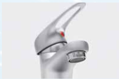
Maintien de joints cylindriques ergo.® 4453 + ergo.® 4455