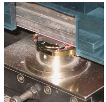
Les fonds de boîtes reçoivent une finition de surface parfaite grâce aux bandes abrasives d'IBZ/Longo