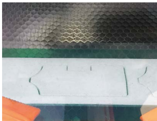
Bande d'étanchéité autocollante simple face estampée sur rouleau