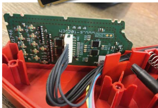
Panneau de commande/circuit imprimé (dessus/dessous)