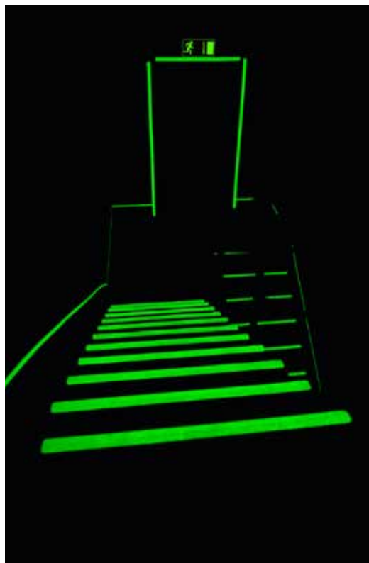
Treppenhaus im Dunkeln mit nachleuchtenden 3M Safety-Walk