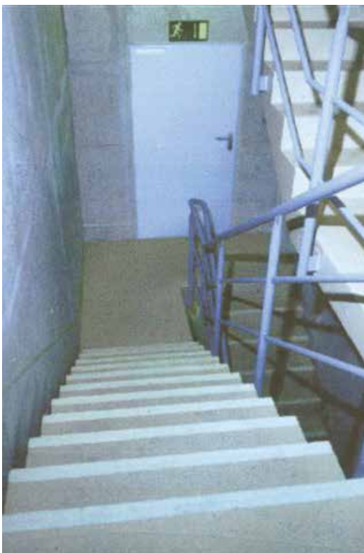
Treppenhaus im Hellen mit nachleuchtenden 3M Safety-Walk