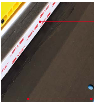
Auf diesem Teil wurde der Primer aufgetragen.

Liner wird vom VHB-Klebeband abgezogen, PVC-Teil hochgeklappt und dauerhaft verklebt.