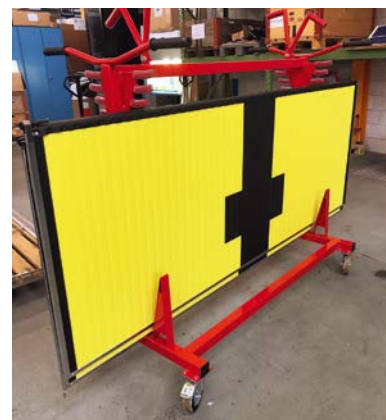
Touchpad steht zur Montage bereit.