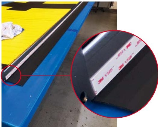
Nach der Reinigung wird das VHB-Klebeband auf das Metall geklebt.

Swiss Timing suchte eine Lösung, damit das Klebeband auf PVC klebt. Denn Kunststoff enthält Weichmacher, welcher die Klebeverbindung unterwandert. Dies führt dazu, dass die Klebeverbindung nicht lange hält. Die Grundierung mit dem Primer 3M Scotch-Weld 9348 löste das Problem. Die Verklebung hält nun zuverlässig und ist zudem auch noch wasserfest.