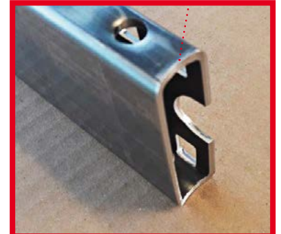
Tischzarge mit eingeschliffener Rundung, damit sich das Stahlprofil dem Tischbein anpasst