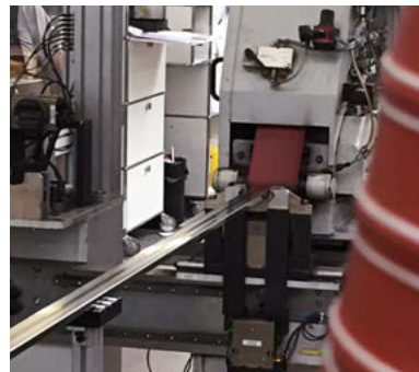
Auf beiden Seiten wird eine Rundung eingeschliffen