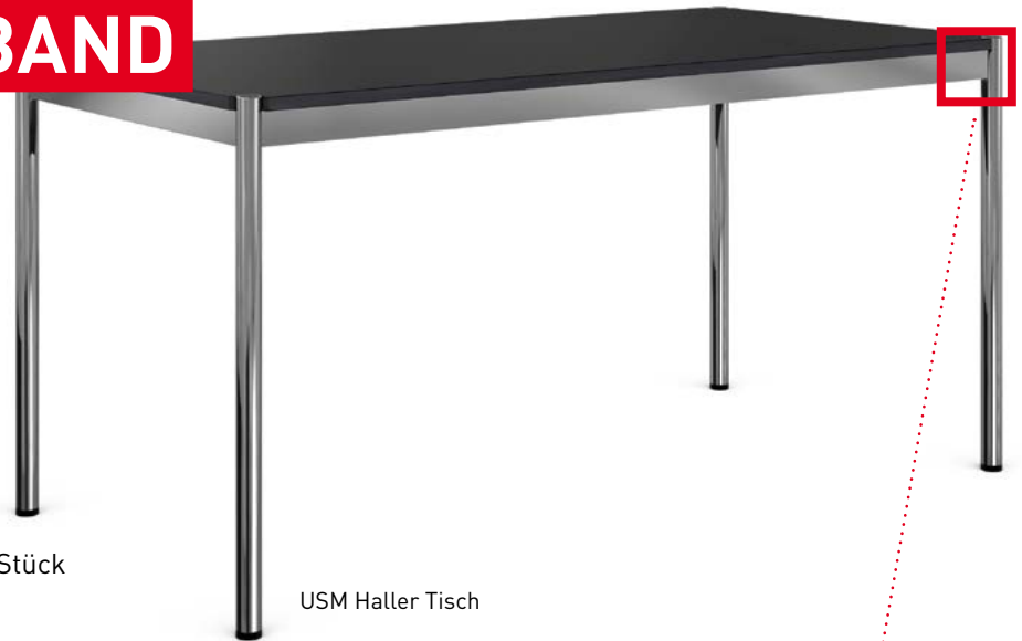
USM Haller Tisch

Nicht nur schneller, sondern auch sehr viel kostengünstiger Durch den Wechsel des Schleifbandes können neu 4000 – 5000 Stück verarbeitet werden, bisher 1200 – 1500 Stück.