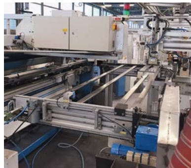
Stahlprofile liegen zur Verarbeitung bereit