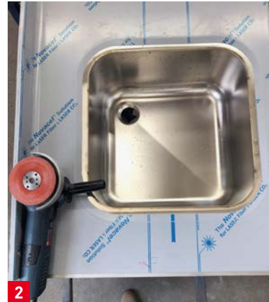
2 Mit dem Winkelschleifer und der 3M 787C Fiberscheibe wird vorab die Kontur vorgeschliffen.