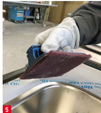
5 Mit 3M CF-RL Scotch-Brite erfolgt die Verfeinerung und der Finish, damit der Chromstahl in seinem schönsten Glanz erstrahlt.