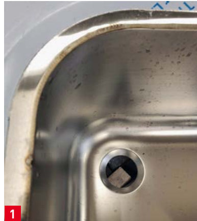
1 Spülbecken vor dem Schliff.