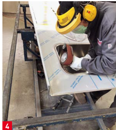
4 Wer schleift, schützt sich: Kombi-Gehör- und Gesichtsschutz (G500) und Handschuhe von 3M. In diesem Arbeitsschritt wird die Oberfläche längs geschliffen.