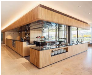
FHNW Muttenz (Fachhochschule Nordwestschweiz)

Die edlen und funktionalen Einrichtungen werden in Hotels, Restaurants, Spitälern, Heimen und Personalrestaurants eingebaut. Drei Beispiele: